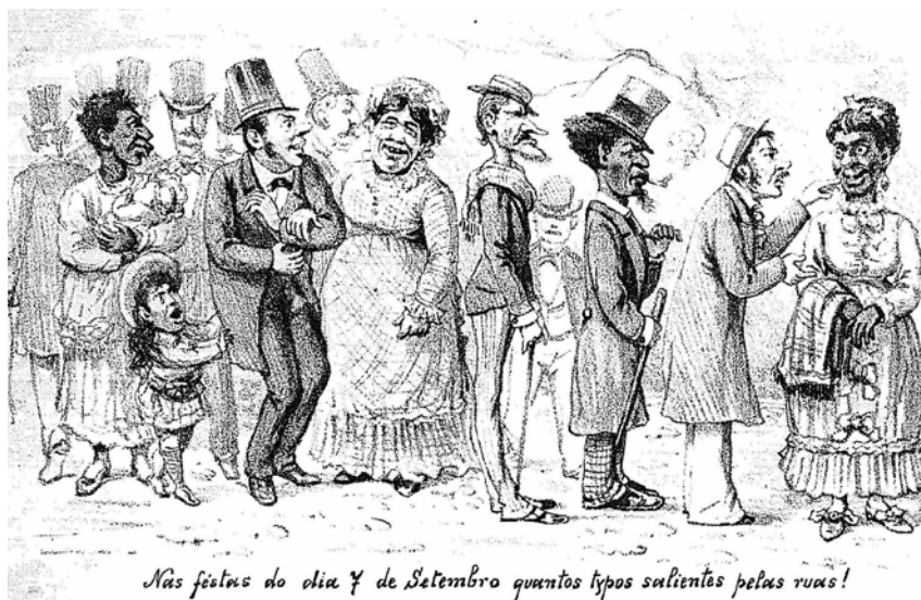
Figura 2 – O Povo nas Comemorações do Sete de Setembro, 1885.

e de cor da pequena elite letrada, culta e detentora do poder político e econômico. Um velho observador das mudanças sociais comentou em 1877 que ninguém (da sua classe, bem entendido) mais saía para visitar “luminárias”, e descreveu a Sociedade Comemorativa como um grupo que lutava para manter vivos os costumes que estavam desaparecendo. Numa matéria reveladora de 1884, a Gazeta de Notícias contrastou o “povo” que se aglomerava em torno da estátua com a “mocidade” que passava a noite “dançando alegremente” aos sons de música carnavalesca nos clubes localizados na vizinhança da praça da Constituição. 43 No ano seguinte, uma charge d’ O Mequetrefe destacou igualmente a origem social baixa e a diversidade racial dos que festejavam na praça (Figura 2). Uma das primeiras memórias da infância do folclorista Luiz Edmundo (1878-1961), filho de um professor da rede pública, era de ir da sua casa em Botafogo “ao centro da cidade gozar as luminárias” nos dias de festividade nacional, memória que ele datava de 1883 ou 1884. Além das despesas com a passagem de bonde, isso foi uma diversão barata para a família de um mal-remunerado empregado público, mas ele não mencionou a praça da Constituição, que, segundo Koseritz, se destacava do resto da cidade como um “rio de luz” derramada por “milhares de bicos de gás”. 44