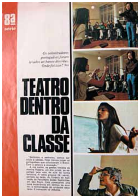
Figura 2 – Escola , nº 0, out. 1971, p.58.