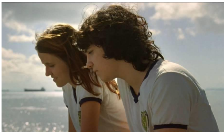
Figura 3: Frame do filme Depois da chuva

Outra imagem que produz diferenciações no modo de construção e nas espacialidades recortadas pela câmera se dá em um quarto escuro atravessado por feixes de luz que parecem vir de uma janela, onde estão Caio, Tales e a garota, os locutores da rádio pirata, além de outro amigo músico. A câmera parada em uma imagem que dura três minutos e quinze segundos, sem cortes, apresenta quatro planos: uma parede ao fundo com um desenho de um homem; Caio e Tales no terceiro plano mimeografando panfletos do programa “O inimigo do rei”; no segundo plano, a garota em pé insinuando alguns movimentos; e o músico no primeiro plano experimentando sonoridades de alguns instrumentos. A cena perdura e os corpos permanecem no lugar, com exceção da garota, que, pelas sonoridades do mimeógrafo e dos instrumentos, deixa seu corpo ser levado e atravessa os planos criados na imagem, desconfigurando o corpo em uma dança que ganha, a cada passagem do tempo, mais intensidade: desconjuntura corporal que traz uma ruptura dos gestos antes apresentados no filme, imagem da qual irrompe um tipo de corpo incorporal, desfazendo as organizações. Novos regimes de corpos e de intensidades individualizam essa imagem de modo a recriar as topias antes presentes, criando nas imagens lugares outros, contraespaços , heterotopias, heterocronias.