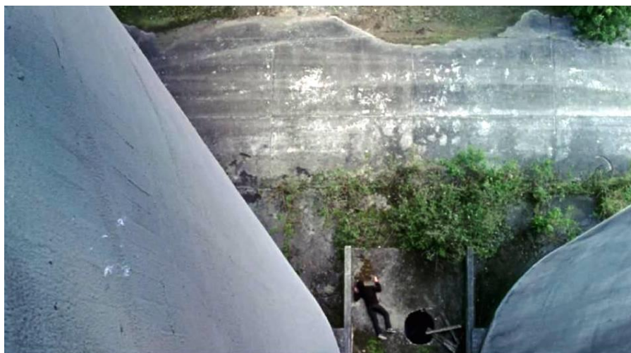
Figura 2: Frame do filme Depois da chuva

Tales precipitou a morte e, com a gravidade de sua queda, construiu um lugar, uma densidade, uma heterotopia com peso suficiente para fazer corpo, contorno no chão, morte para fazer passar uma vida utópica. Há nessa cena uma duração, um posicionamento de câmera e uma composição entre corpos, quadros e planos não convencionais às imagens apresentadas na maior parte do filme. É uma espécie de composição intensiva que abre as sensibilidades a outras imagens, novas individuações em que o filme lança devires e blocos de percepções em vórtices, nos limiares e nas rupturas, perceptos liberados entre afectos 10 inesperados diante das significações tecidas na narrativa convencional, produzindo quebras nos encadeamentos esperados conforme o decorrer da montagem proposta até então. Trata-se de uma abertura aos afectos implicados na condição do personagem, das espacialidades e das temporalidades, colocando as relações entre signos e forças em novas distribuições de potências no próprio filme ao construir uma heterotopia das imagens.