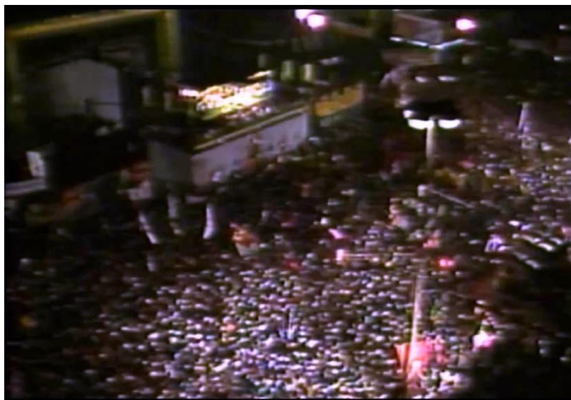
Figura 1: Frame do filme Depois da chuva

Primeira cena: imagem granulada, imagem-arquivo, espaço aberto, talvez uma praça. Uma mulher, em plano fechado, enuncia num palanque as novas aberturas políticas de um momento histórico brasileiro. A câmera se abre em panorama e apresenta uma multidão agitando bandeiras do Brasil, cantando em um uníssono coro “vem, vamos embora/ que esperar não é saber/ quem sabe faz a hora/ não espera acontecer”. Segunda cena: imagem clara, imagem turva, espaço sala, talvez uma escola. Alunos uniformizados, em planos fechados, debatem. A câmera, entre focos e desfocos, apresenta adolescentes discutindo, aparentemente num espaço escolar. Um personagem anuncia: “acabo de voltar da diretoria e trago boas notícias; aceitaram a criação de uma associação estudantil”; informa que as eleições para essa associação serão