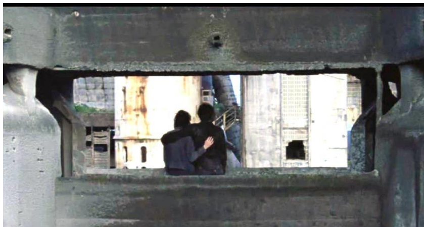
Figura 5: Frame do filme Depois da chuva

Para finalizar, volta-se ao pensamento das construções de heterotopias no filme Depois da chuva , apresentadas nas narrativas temáticas e nas imagens elaboradas. O ponto de partida foi o convite ao atrevimento de chegar a face às cinzas, como nos propõe Didi-Huberman (2012), soprando-as suavemente para que dali se acendam brasas interessantes para forçar o pensamento e combater os clichês. Imagens individualizam-se no meio fílmico, na produção de outras espacialidades, outras temporalidades, contraespaços e novos tópos corporais. Aqui foi proposto considerar as práticas disciplinares, que ainda persistem no período pós-ditatorial no Brasil e que, por isso mesmo, desafiam os corpos utópicos a ensaiar, no transcorrer do filme, a construção de algum lugar heteróclito nas imagens. Nesse movimento, a educação foi arrastada para um heterotopos , em construções operantes na irrupção de imagens inesperadas de dentro das imagens clichês. Estas narrativamente constroem um lugar-comum que, no entanto, é problematizado por uma heterotopia das imagens capaz de redistribuir as potências do próprio filme, tanto espaciais quanto temporais.