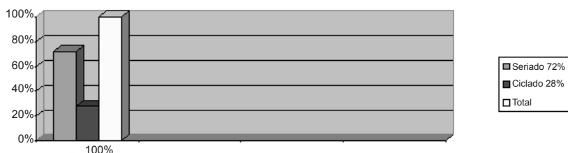
GRÁFICO 3 – DISTRIBUIÇÃO PERCENTUAL DE REDES MUNICIPAIS DE ENSINO FUNDAMENTAL SERIADAS E CICLADAS NO ESTADO DO RIO DE JANEIRO/2010

Observa-se que há uma maior concentração da adoção dos ciclos nos dois primeiros anos do Ensino Fundamental, ou seja, nos anos da alfabetização. Tal predominância nos revela que a compreensão da alfabetização como um processo está solidificada entre os educadores. Mesmo com o enxugamento das propostas de ciclos, como veremos nos gráficos a seguir, que mostram o panorama de 2010 das redes municipais de ensino do Rio de Janeiro, verificamos que o sistema seriado prevê a não retenção das crianças do primeiro para o segundo ano. O Ministério da Educação (MEC) recomenda em seus documentos para a implantação do Ensino Fundamental de nove anos a não retenção dos alunos nos anos iniciais, respeitando as características de cada rede.