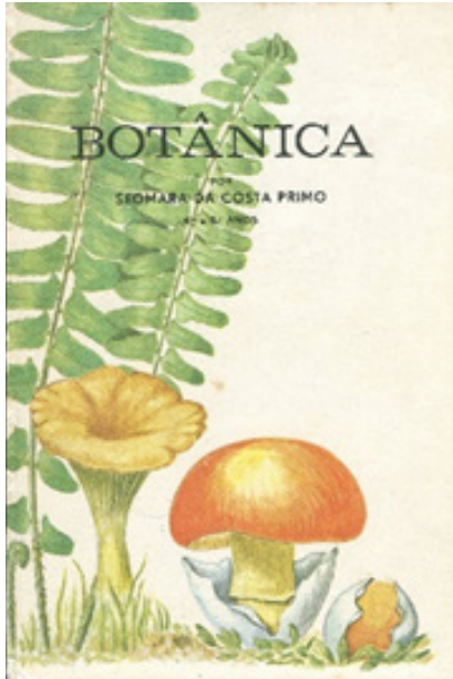
FIGURAS 2, 3 E 4 – MANUAL ESCOLAR; QUADRO GERAL DOS GRUPOS VEGETAIS (ESTAMPA); ESTUDO PARA QUADRO PARIETAL SOBRE AS LEIS DE MENDEL, DE SEOMARA DA COSTA PRIMO