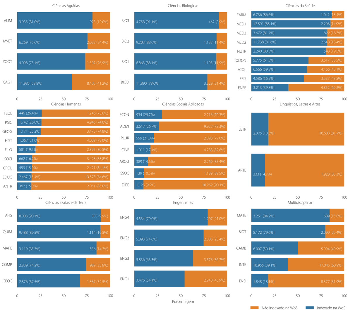
Gráfico 4 – Cobertura de artigos de Programas de Pós-Graduação brasileiros indexados na Web of Science por Área de Avaliação Capes – período 2017-2018.

Fonte: Elaborada pelos autores com base nos dados extraídos da Plataforma Sucupira e da Web of Science em maio de 2020.