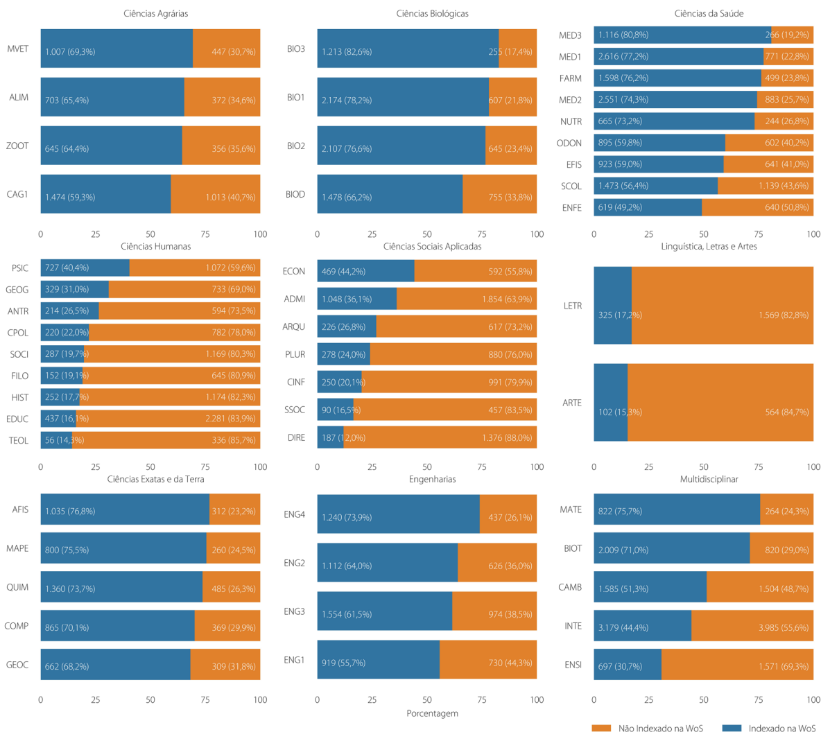
Gráfico 3 – Cobertura de periódicos indexados na Web of Science utilizados pelos Programas de Pós-Graduação brasileiros por Área de Avaliação Capes – período 2017-2018.

Fonte: Elaborada pelos autores com base nos dados extraídos da Plataforma Sucupira e da Web of Science em maio de 2020.